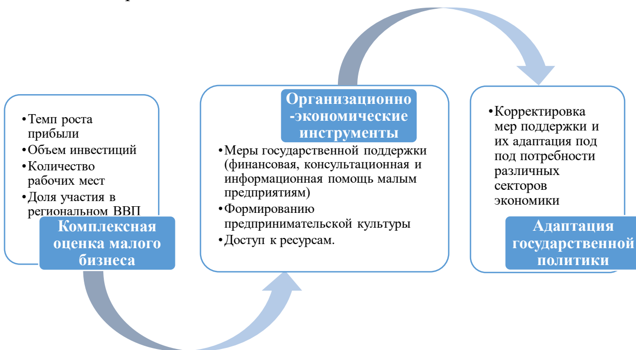
Рис. 3. Сущность механизма оценки развития малого бизнеса

Рассмотрим механизм оценки и повышения эффективности развития малого бизнеса, сущность которого заключается в разработке системы инструментов, которая позволяет оценить состояние и динамику развития данного сектора экономики, а также создать условия для устойчивого экономического роста и повышения социальной значимости малого бизнеса. На рис. 3 показана схема проведения оценки развития малого бизнеса, состоящая из трех основных этапов.