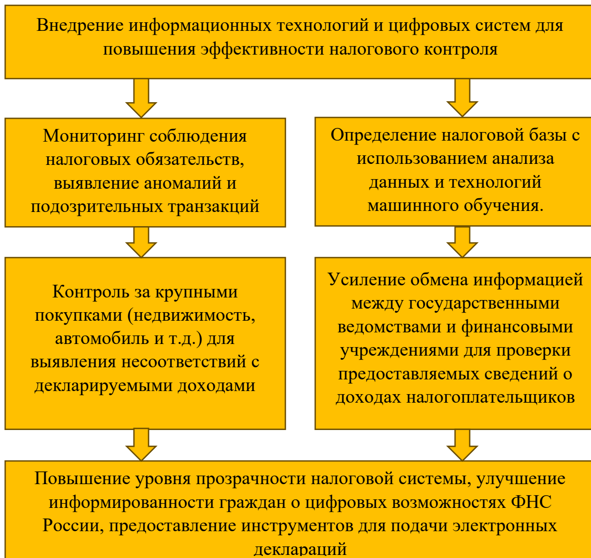
Рис. 4. Перспективные направления развития налогового контроля за доходами и расходами физических лиц

приобретении объектов недвижимости, автомобилей и иных ценностей, получаемая соответствующими ведомствами, будет передаваться в ФНС России для обработки с целью выявления несоответствий с декларируемыми доходами.