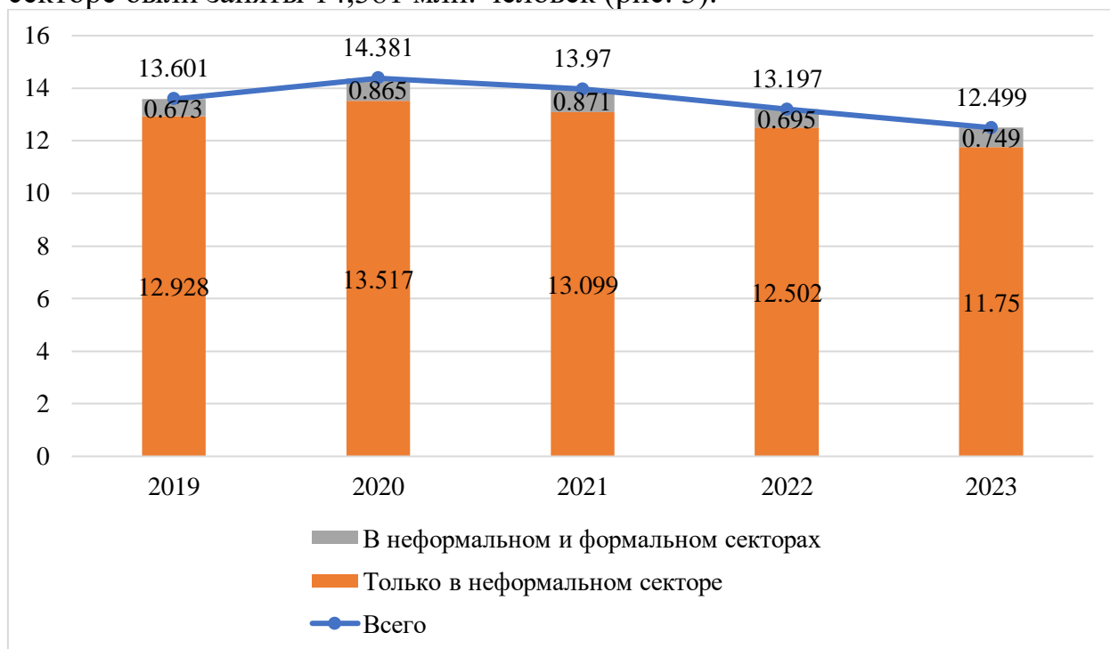
Рис. 3. Динамика количества занятых в неформальном секторе по типу занятости, в млн чел.

Согласно подходу С.И. Михеева, такие финансово-экономические факторы, такие как коррупция в государственном секторе, а также неэффективность и сложность налоговой системы – мотивируют уклонение со стороны физических лиц от уплаты налогов. Кроме того, до конца несформированная финансово-экономическая политика государства влияет на структуру национальной экономики и способствует развитию неформальной занятости [5]. Так, согласно представленным данным, в 2023 году в неформальном секторе были заняты 12,499 млн. человек. Пик неформальной занятости наблюдается в период пандемии: в 2020 году в неформальном секторе были заняты 14,381 млн. человек (рис. 3).