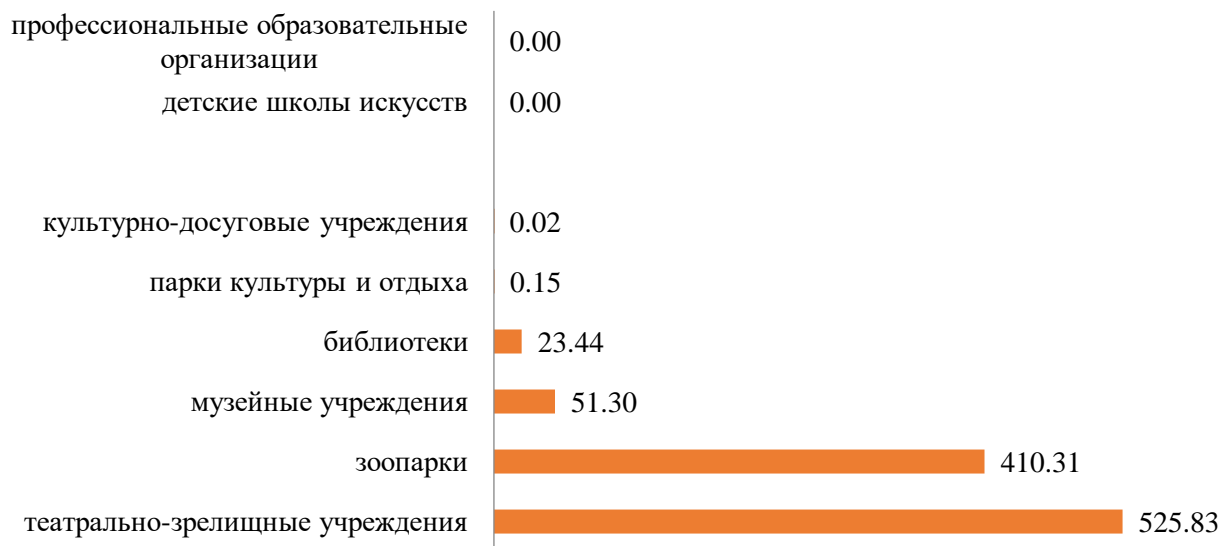
Рис. 3. Визуализация рейтинга отраслей культуры по коммерческой доходности одного посещения, руб./чел.