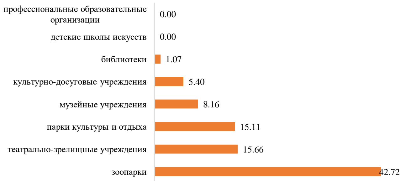
Рис. 4. Визуализация рейтинга отраслей культуры по доле приносящей доход деятельности в общем объеме поступления финансирования, %

Рейтинговая модель позволяет выявить приоритеты стратегического управления в интенсификации творческих отраслей.