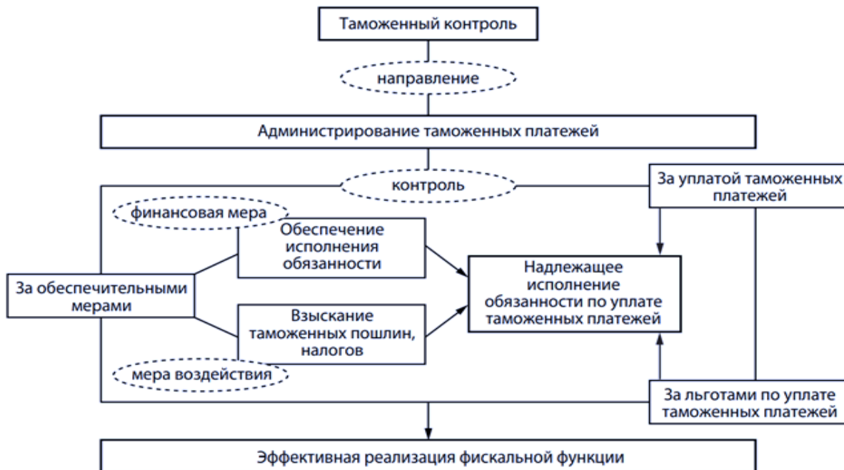
Рис. 3. Место и роль обеспечения исполнения обязанности по уплате таможенных платежей в процессе проведения таможенного контроля

инспекцию товаров, аудит деятельности компаний и применение мер в случае выявления нарушений. Таможенные проверки могут быть как плановыми, так и внеплановыми, в зависимости от уровня риска, связанного с определенным импортером или экспортером.