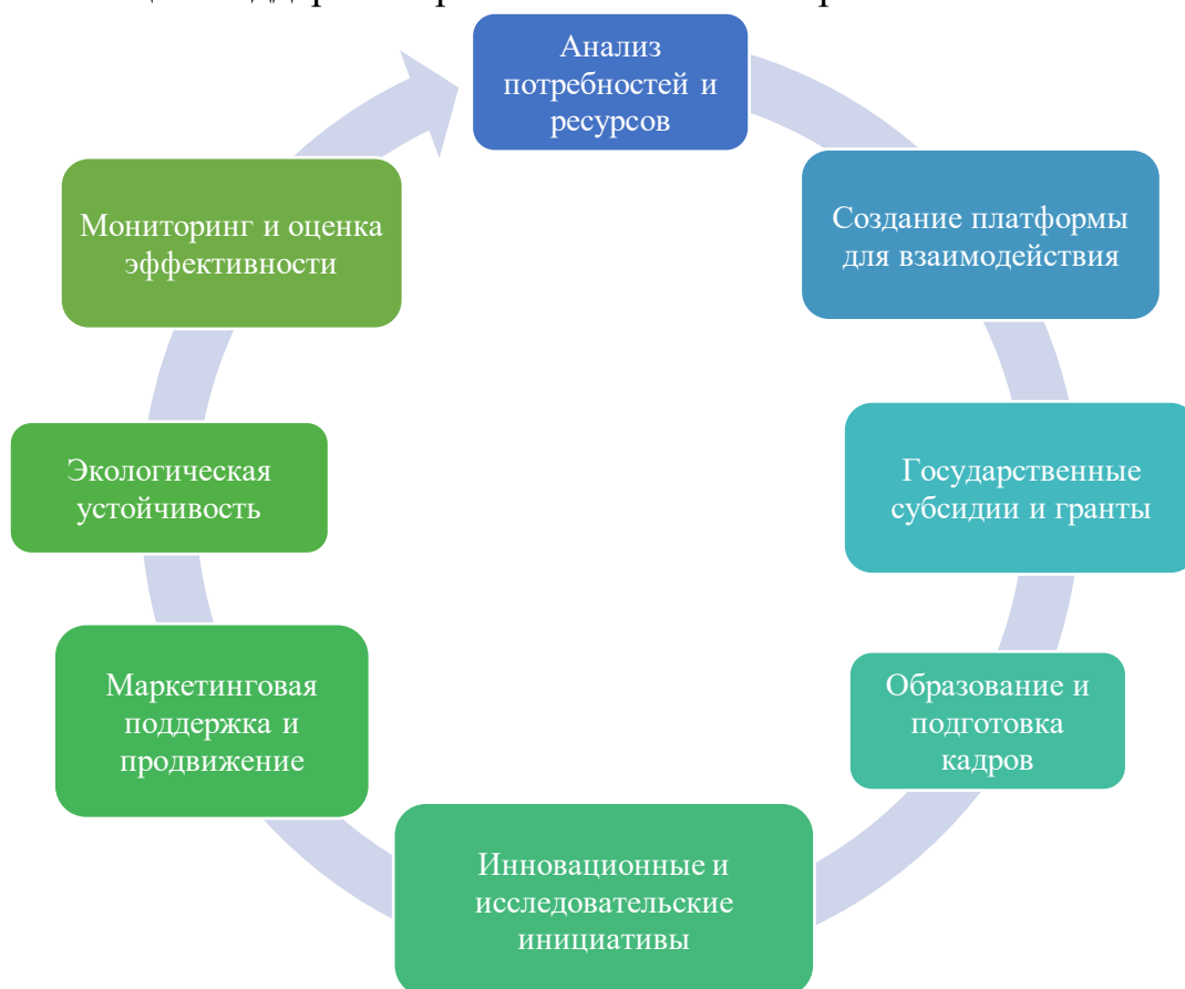
Рис. 2. Предложения по оптимизации политики поддержки промышленных кластеров

Оптимизация политики поддержки промышленных кластеров требует комплексного подхода. Ниже представлены (рис. 2) несколько предложений по оптимизации поддержки промышленных кластеров.