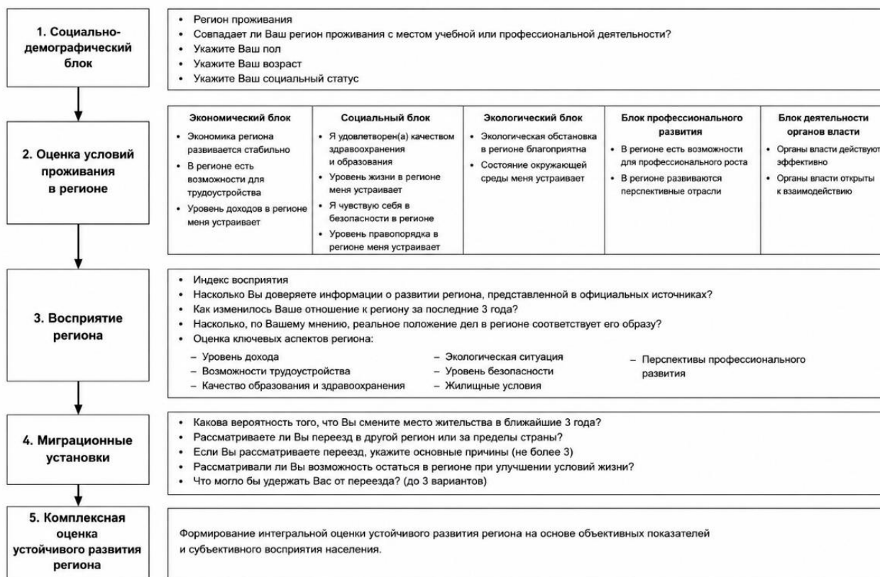
Рис. 1. Структура социологического опроса населения